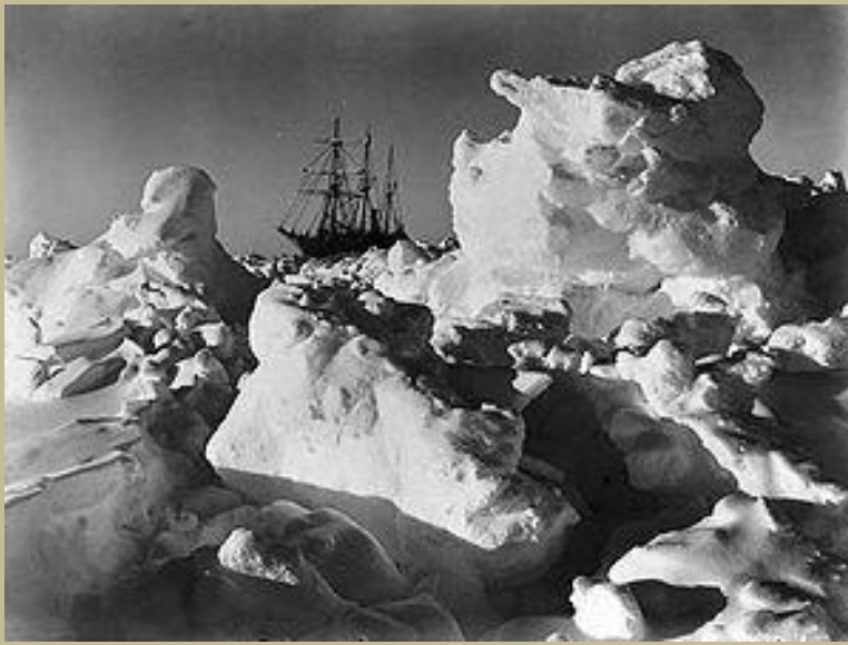
Endurance atrapado en el hielo