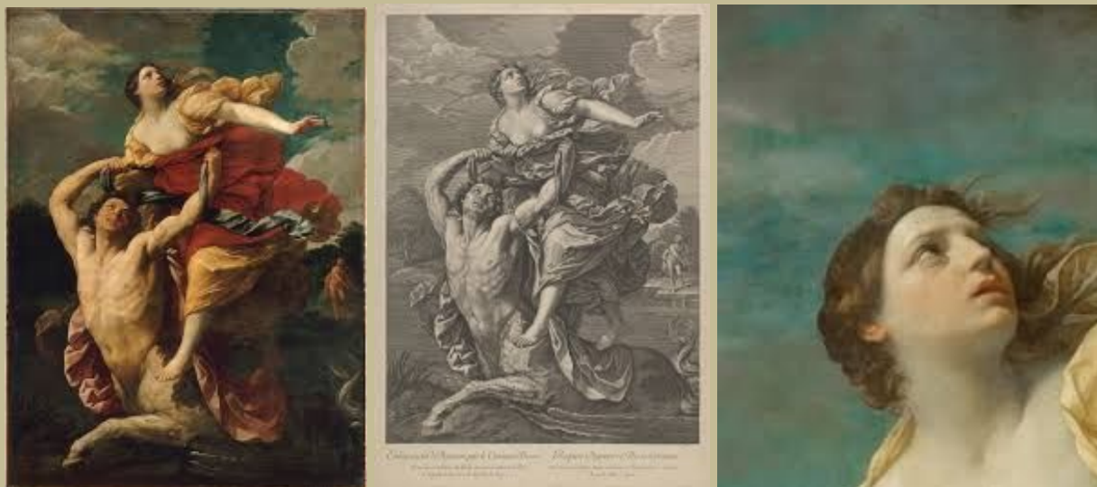
Deianeira Abducted by the Centaur Nessus - Guido Renis 1621 - Museo Louvre París