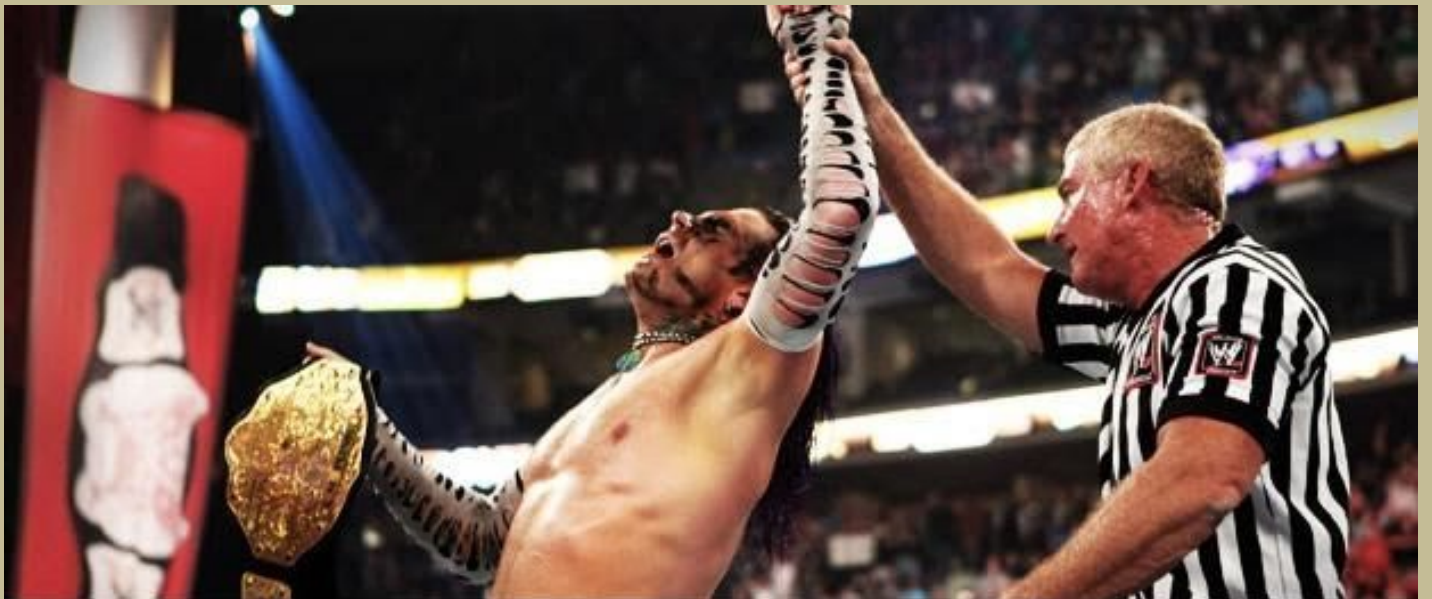
Jeff Hardy campeón pesos pesados