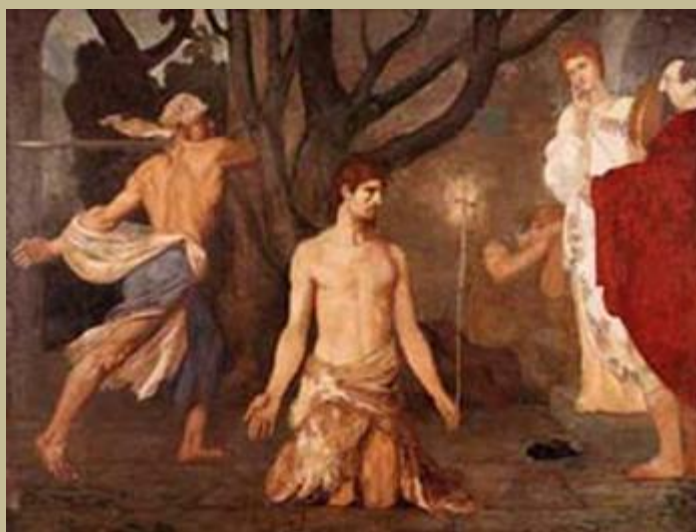
Juan el Bautista en el instante previo a ser decapitado