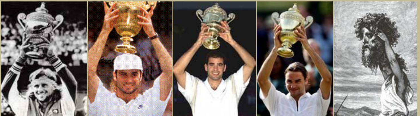
Borg, Agassi, Sampras y Federer levantan la copa de Wimbledon. David hace lo propio con la cabeza de Goliat

Cuando el deportista levanta el trofeo hacia su público continúa la tradición guerrera de la época en que el jefe de la tribu o ejército levantaba la cabeza del enemigo hacia sus guerreros y pueblo. De la misma forma en que un cazador enumera sus presas colgando sus cabezas, el deportista cuenta sus victorias acomodando sus copas en la vitrina. En la guerra, tanto en oriente como en occidente, era costumbre tomar la cabeza del enemigo vencido para su exhibición.