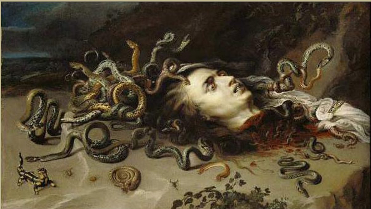
En la mitología griega, Medusa (en griego antiguo Μέδουσα Médousa, de μέδω medō, 'mandar', 'reinar'[1]) era un monstruo femenino cuya mirada convertía a la gente en piedra.