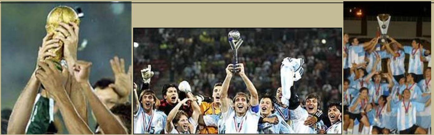
Los mundiales de fútbol recrean la euforia de la victoria