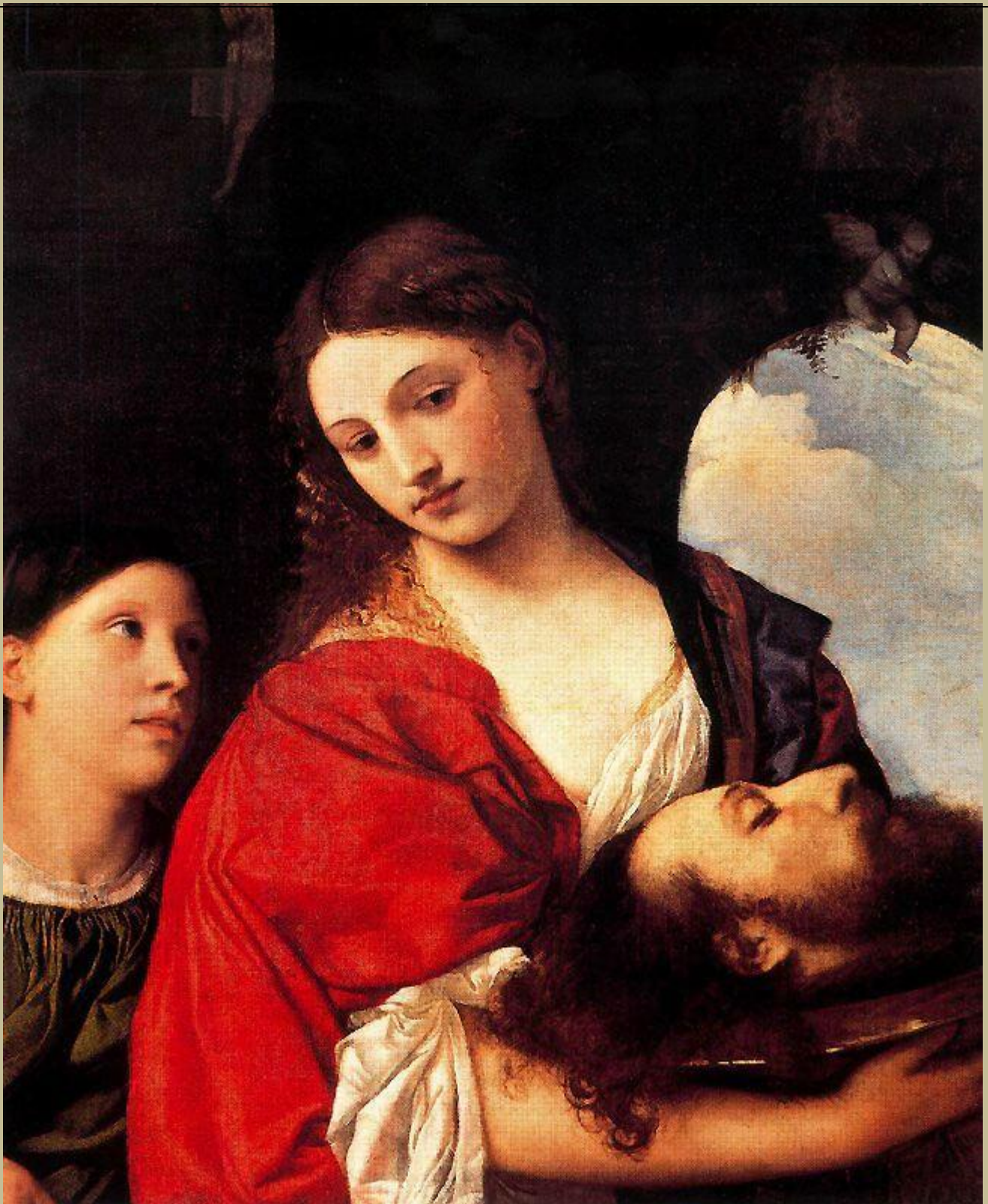
Tiziano Judith con la cabeza de Holofernes o tal vez Salomé