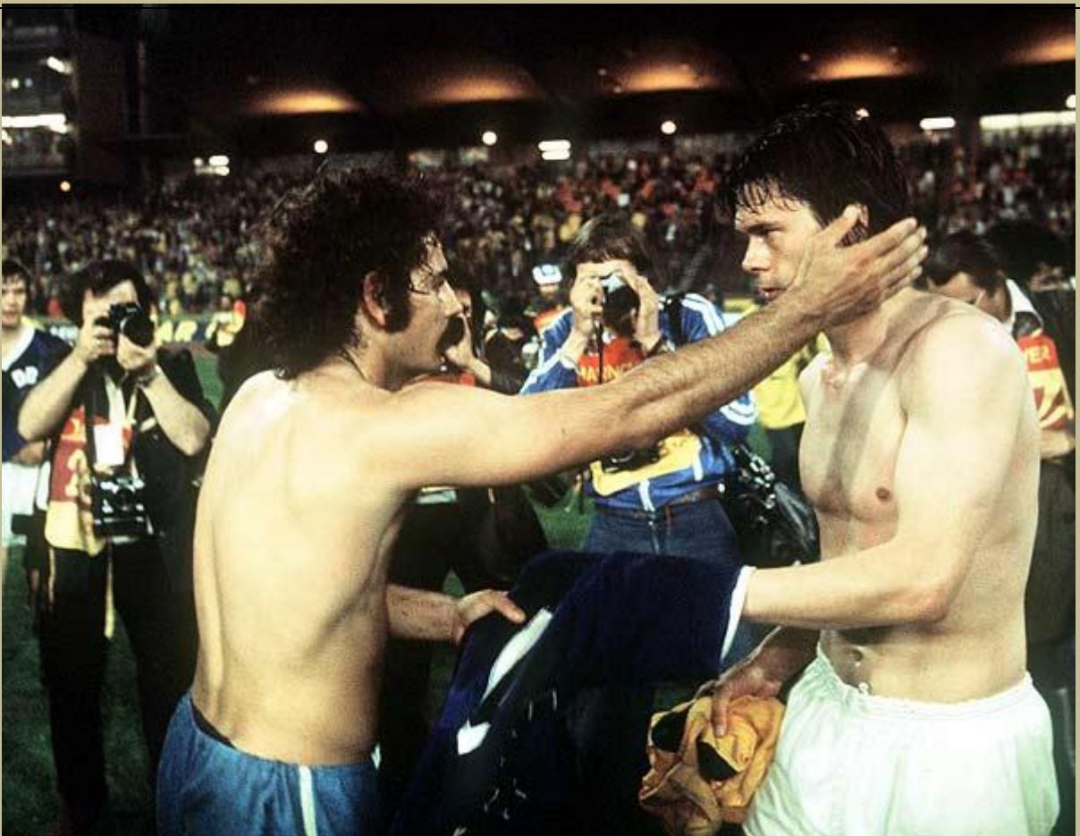
El brasileño Roberto Rivelino (izq.) intercambia su camiseta con el alemán Juergen Sparwasser después de la victoria 1-0 para Brasil en Hannover en el Mundial de 1974.