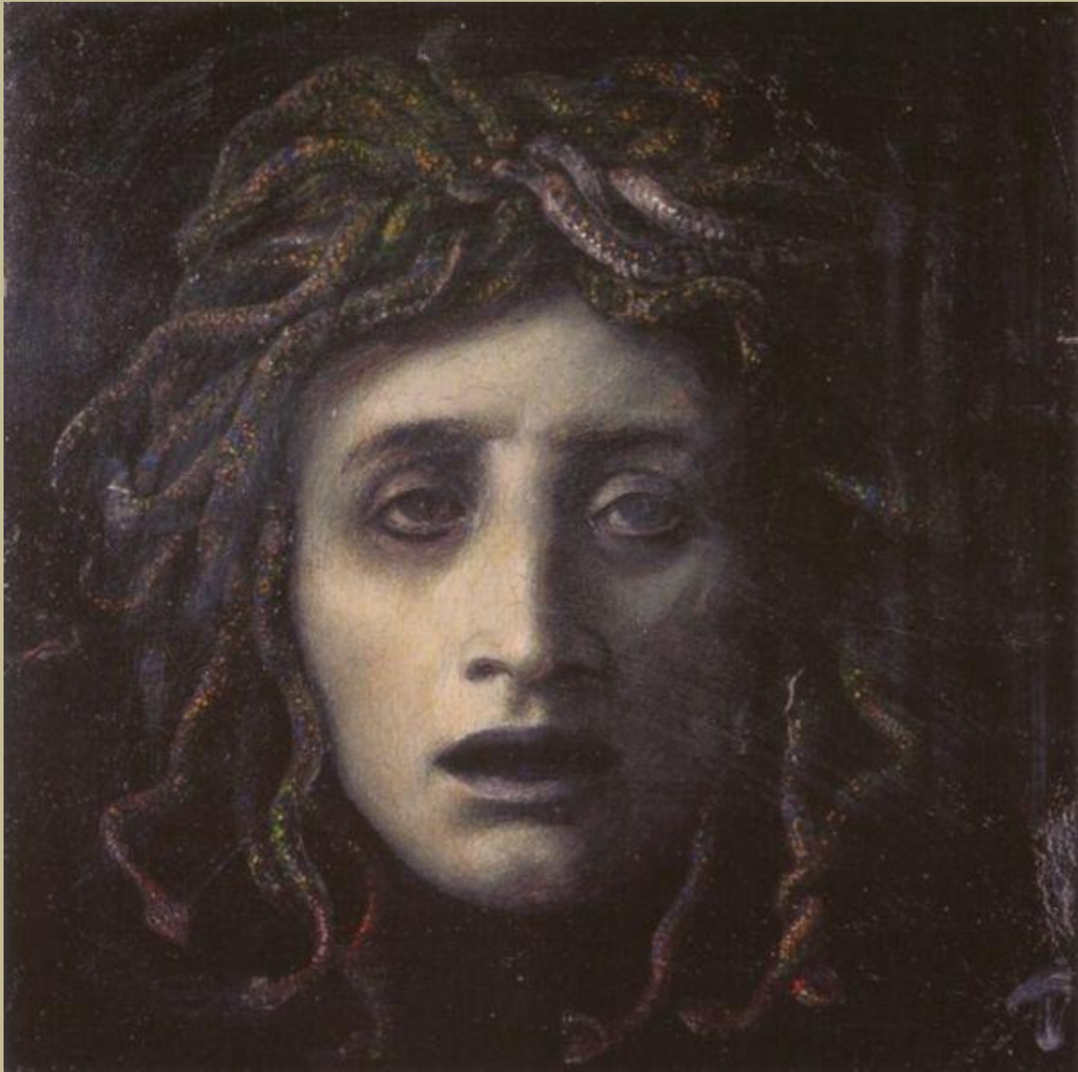
Medusa de Arnold Böcklin, una imagen relativamente moderna