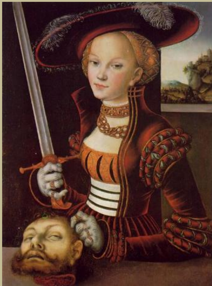
Cranach 1530 "Judith victoriosa"

La bella y heroica Judith, previa estrategia de seducción, decapita al cruel general Holofernes que sitiaba al pueblo judío. izq. Caravaggio. Der. Botticelli "El regreso de Judit " con su criada portando la cabeza como trofeo. VER ARTÍCULO