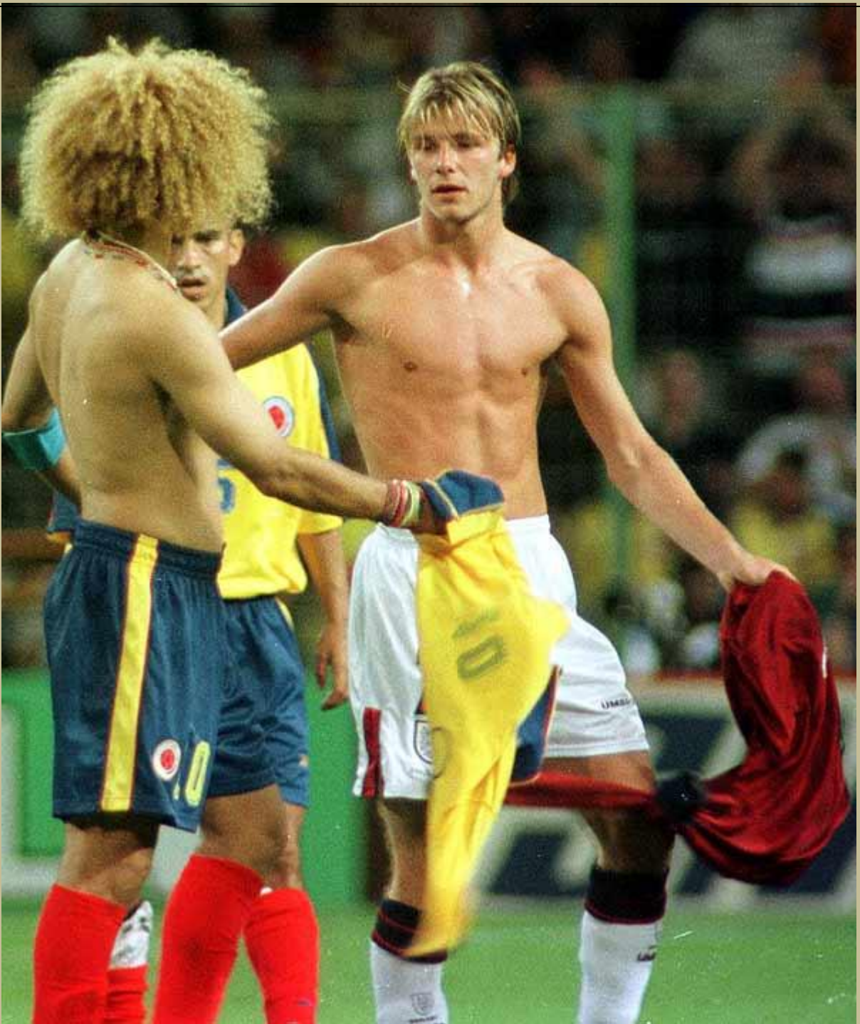
El centrocampista David Beckham (der.) intercambia la camiseta con el capitán de la selección colombiana, Carlos Valderrama, después de que Inglaterra derrotara a Colombia 2-0 en la final del Mundial de 1998.