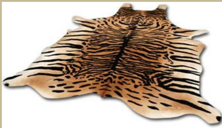
Cada día causan más repulsión las pieles de animales utilizadas para cualquier tipo de uso o exhibición