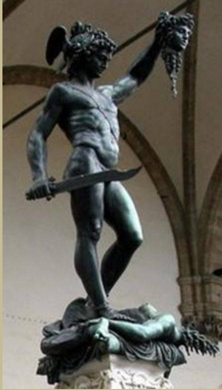
Perseo sosteniendo la cabeza de la Gorgona Esta, con solo mirar a los hombres los convertía en piedra. La es pada es un símbolo fálico que representa el poder de héroe Museo del Vaticano. Roma

Algunas referencias clásicas la describen como una de las tres hermanas Gorgonas, la única mortal de ellas. Medusa, Esteno y Euriale eran despiadados monstruos de manos metálicas, colmillos afilados y cabellera de serpientes venenosas vivas, lo que indicaba su naturaleza ctónica.