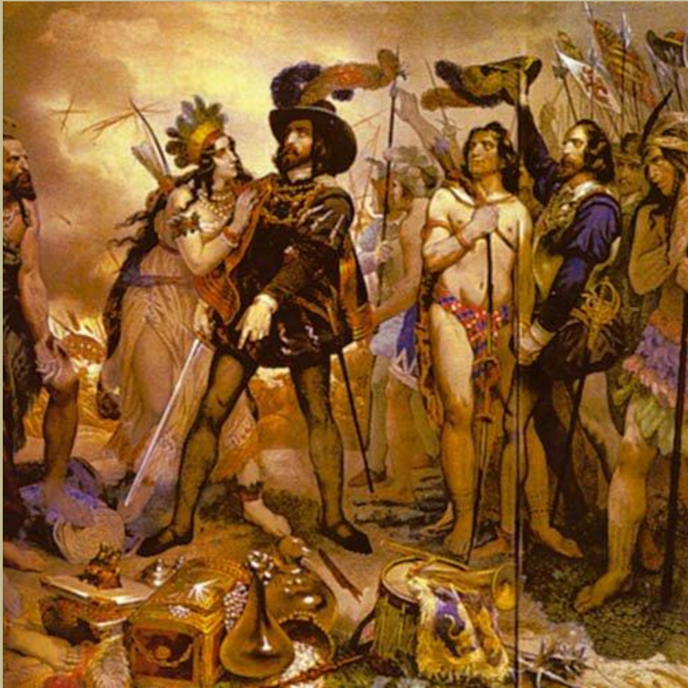
Moktezuma, Hernán Cortés saquea a los pueblos originarios de América, El oro y las riquezas son su "premio"