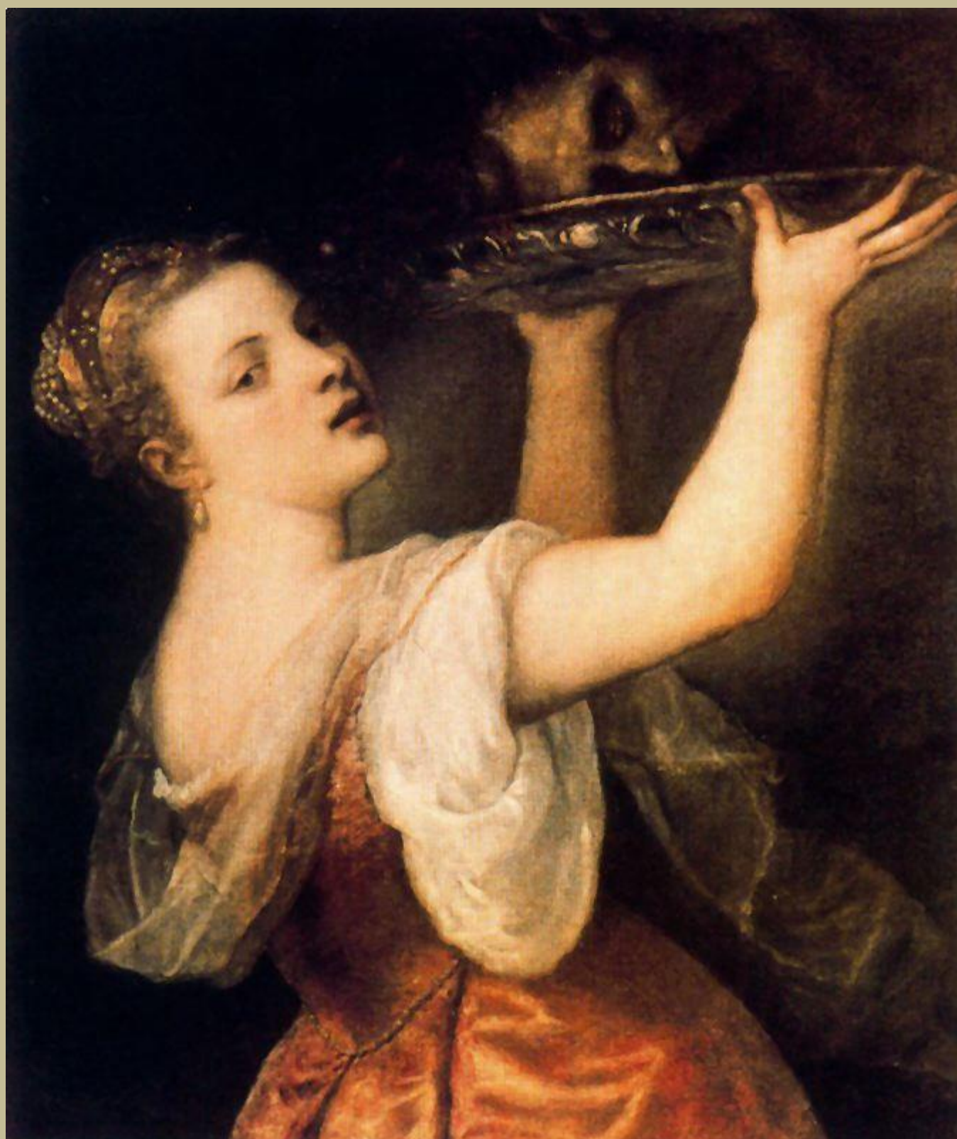
Tiziano - (Tiziano Vecellio di Gregorio) Judith con la cabeza de Holofernes

La crueldad femenina triunfa frente a la virtud Herodías, cuñada y mujer de Herodes hace pedir la cabeza del profeta Juan El Bautista en un plato o bandeja. Este es otro símbolo de triunfo. La bandeja puede entregarse al subcampeón, como en algunos Grand Slams O adjudicarse directamente al ganador como en la Copa Davis