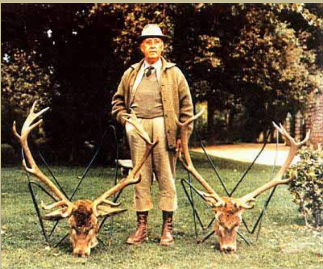
La exhibición de la muerte - El dictador Franco posa con dos trofeos de caza