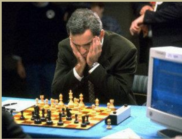
Aquí se enfrenta a la computadora Deep Blue, de IBM

- Hace tiempo que usted trabaja en una colección de libros en los que vincula la evolución del ajedrez con las ideas científicas y sociales de cada época.