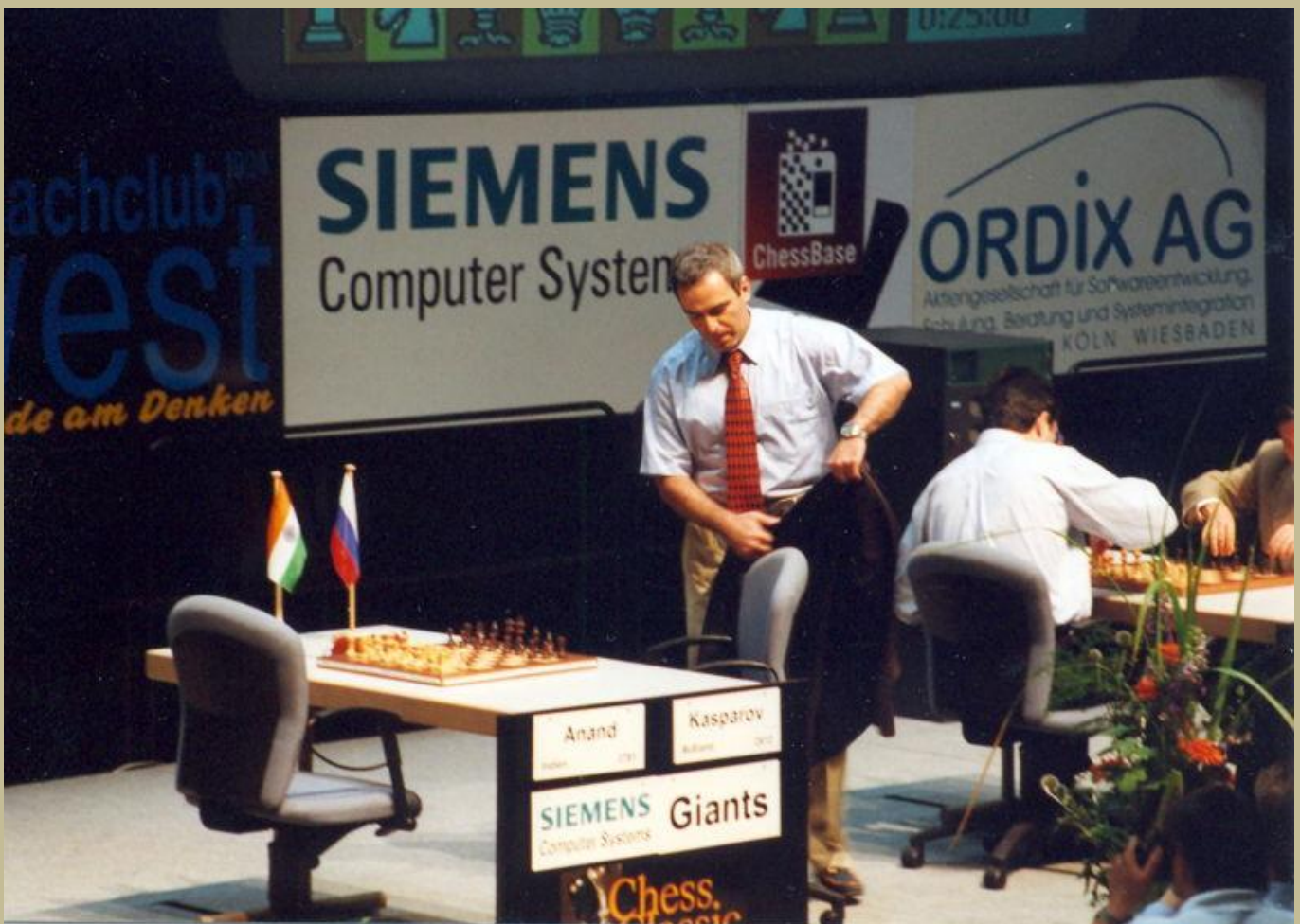
Kasparov, "Ajedrez clásico", en 1999, en Fráncfort , Alemania