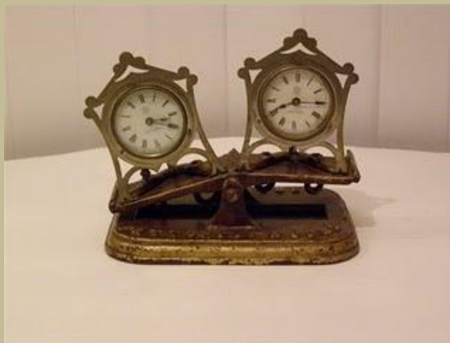
Primer reloj utilizado en la historia del ajedrez

El reloj de ajedrez consiste en dos relojes que contabilizan el tiempo invertido por cada jugador para pensar sus jugadas. Cada botón apaga el reloj propio y prende el del rival. Los jugadores veloces piensan usando el tiempo del otro