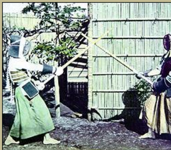
Luchadores de "kendo". Fotografía a la albúmina coloreada a mano. Realizada hacia 1890