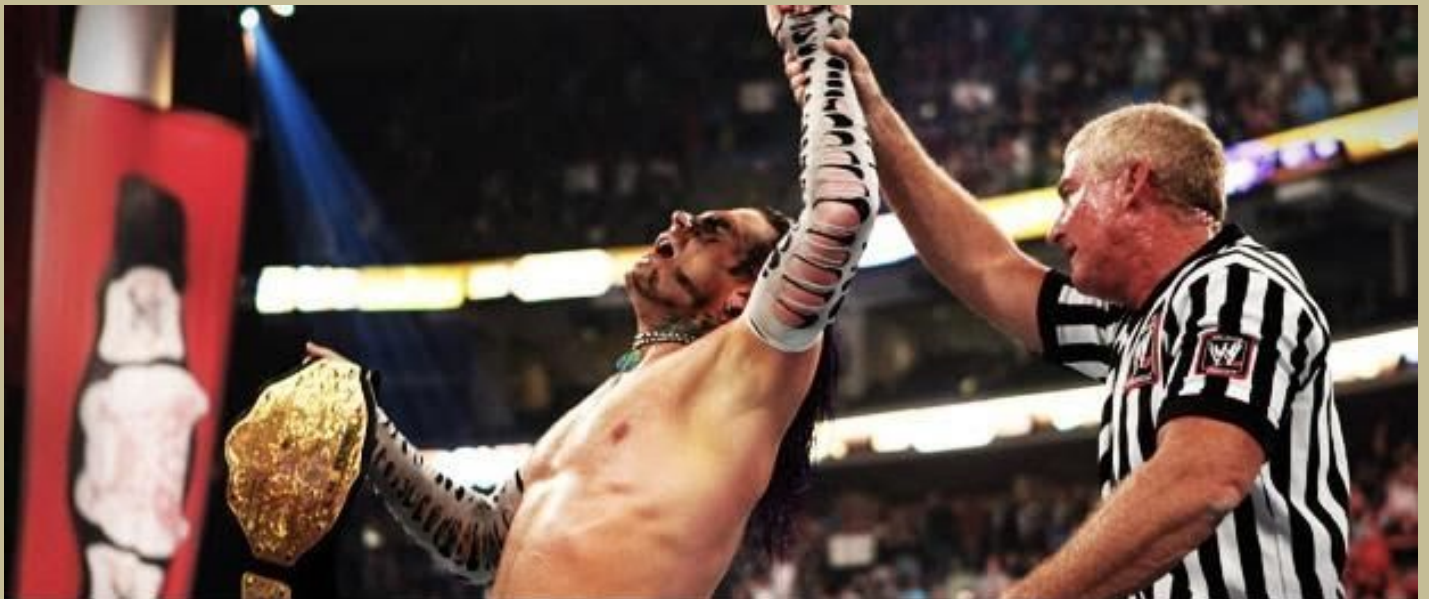
Jeff Hardy campeón pesos pesados