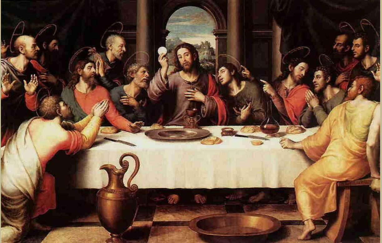
Última Cena, autor desconocido.

En el plano opuesto, Cristo se llamó a sí cordero de Dios y en su caso la expresión fue metafórica en relación a su ser pero no en relación a su concreto destino sacrificial. Su sacrificio fue el último con sangre, su frase tomad y comed porque este es mi cuerpo y tomad y comed porque esta es mi sangre instituyó el fin de los sacrificios cruentos, el judaísmo también abandonó esta práctica sacrificial. La inquisición no dio muestras de entender este claro mensaje.