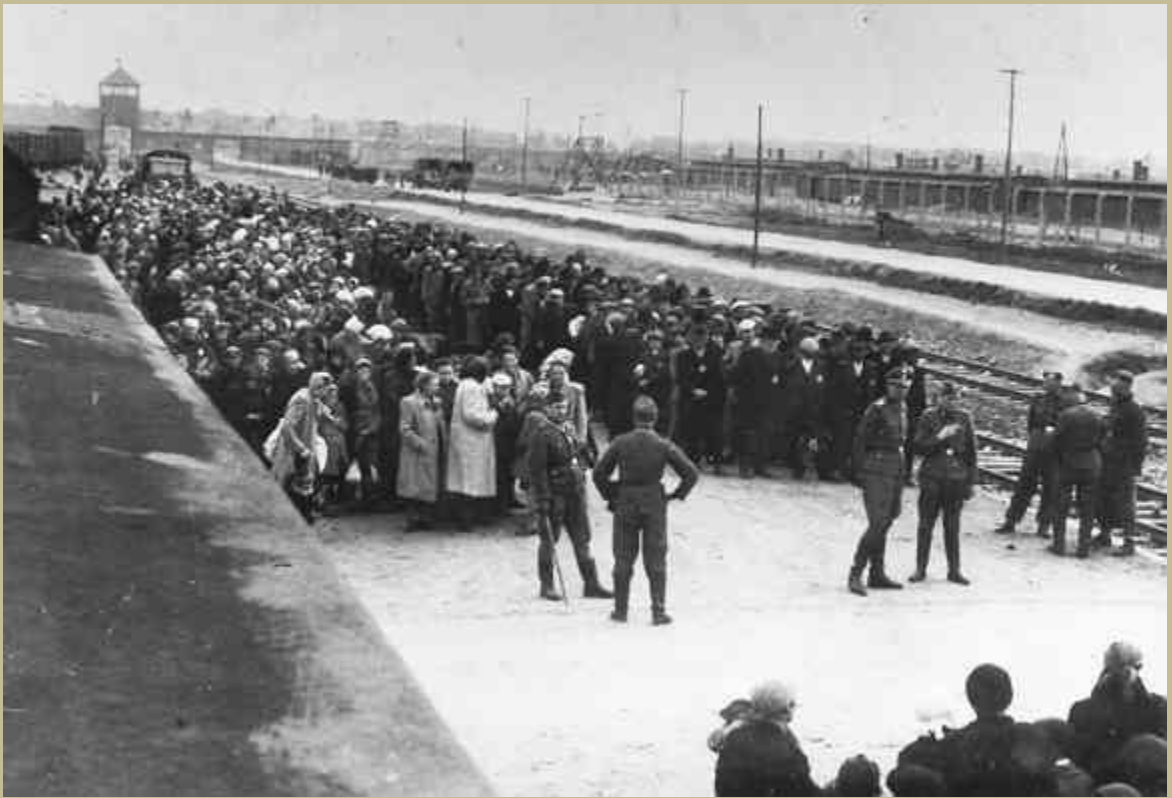
El ingreso al Campo