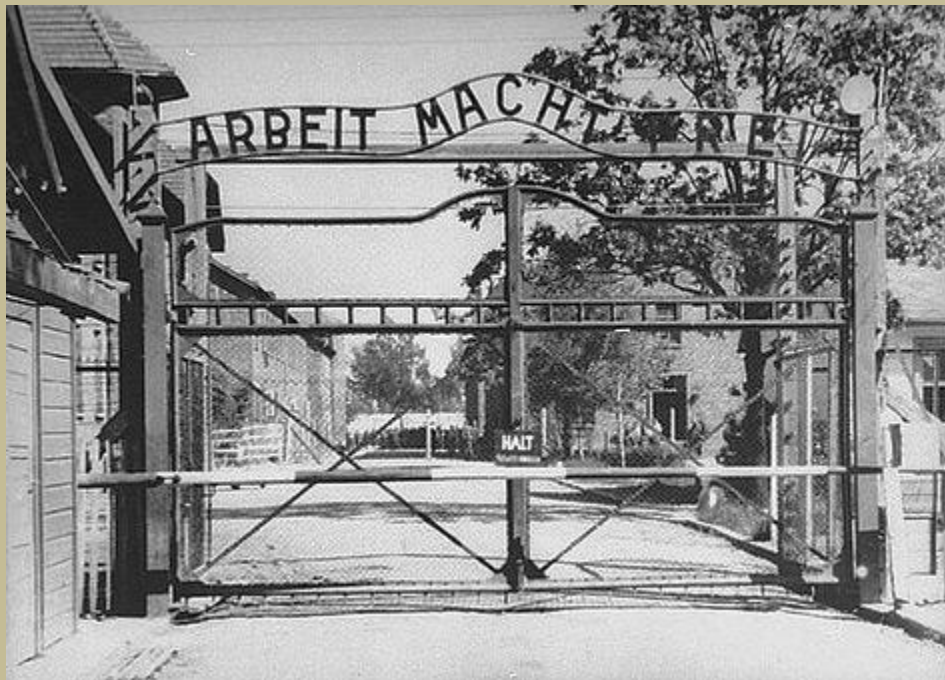
El trabajo nos hará libres Dramática ironía en el ingreso a Auschwitz