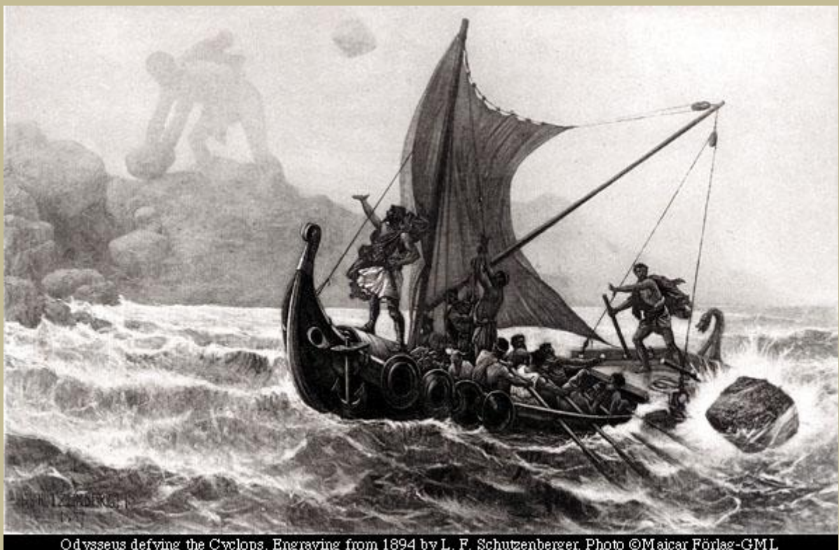
Odysseus defying the Cyclops. Engraving from 1894 by L. F. Schutzenberger.