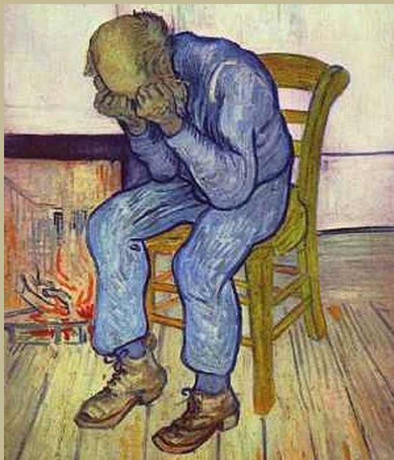
Depresión - Vincent Van Gogh

La depresión suele suceder a la angustia, o bien se alterna con ella. Aunque pueden complicarlo severamente no son enfermedades del cuerpo, ambas son enfermedades del alma y deben ser tratadas como tales. De la misma forma que cuando suena una alarma, primero se investiga la causa que le da origen. Las alarmas electrónicas a veces fallan y no hay problema alguno que resolver, solo entonces las silenciamos. En cambio la angustia, como afecto central del ser humano, es un índice certero que no falla ni engaña, aunque no revela con facilidad sus secretos y enigmas. Entonces no queda otro camino que ocuparse de nuestros problemas. Si se me permite extender la idea, como país hemos seguido históricamente el mismo camino sobre el que tratamos de advertir, no