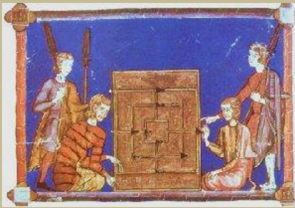
Juego del Molino Libro Ajedrez Alfonso X

Imagen de tablero idéntica al "alquerque vetón" de Jugimo. Se trata del "Juego del Molino", antiquísimo y ligeramente distinto del "alquerque", cuyo tablero también se representa en otra miniatura del valioso "Libro de Ajedrez, Dados y Tablas" del sabio Alfonso X (1221-1284). El original del mismo se conserva en la Biblioteca del Monasterio de El Escorial (Madrid). Véase especialmente gamesmuseum.uwaterloo.ca/Alfonso/ , con el detalle de varios, entre ellos también el "backgammon".