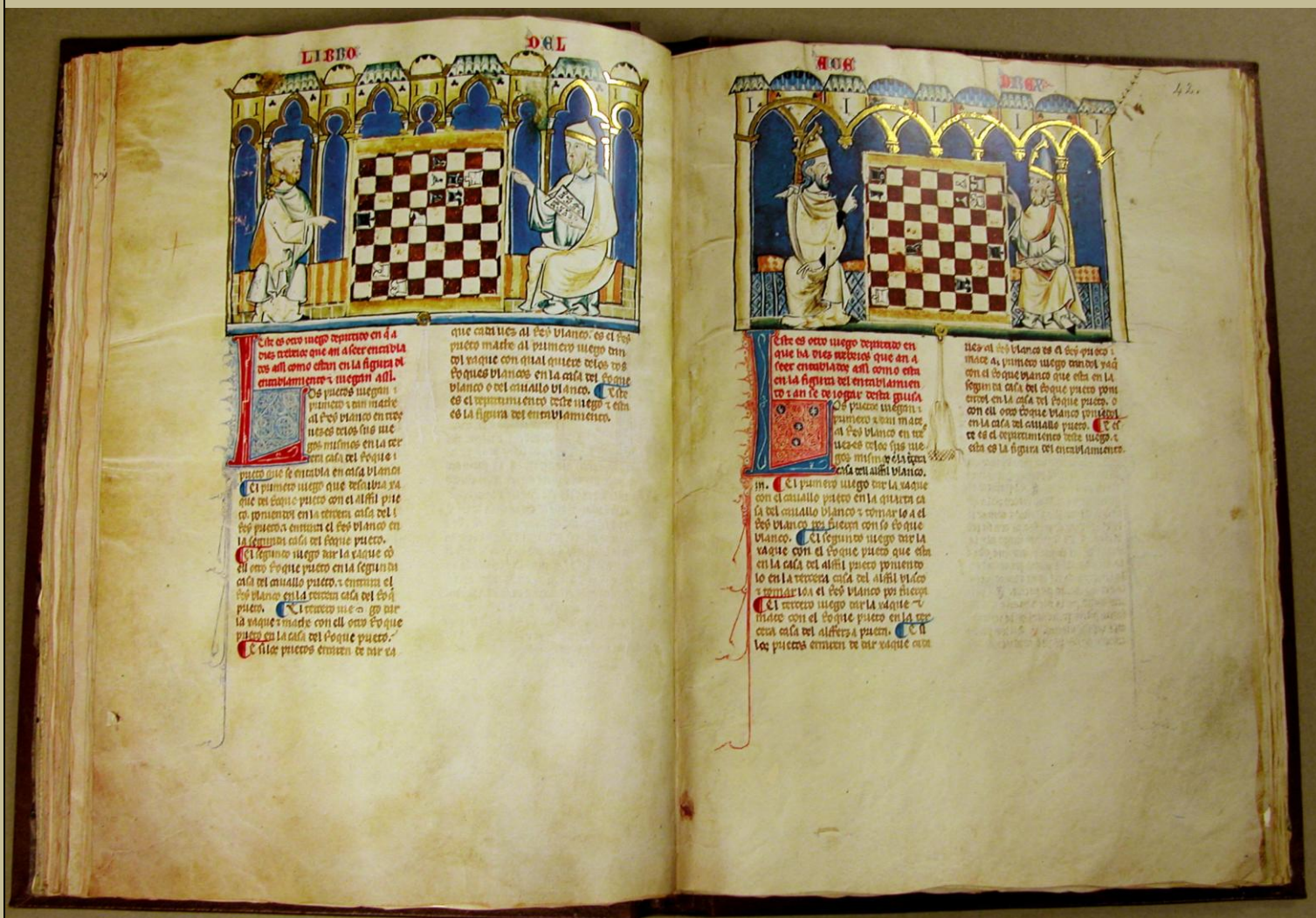
Grabado del siglo XII del Libro de ajedrez, dados y tablas , de Alfonso X el Sabio.

Hasta este momento hemos presentado una serie de errores que tienen un denominador común: todos ellos de una forma u otra provienen de una insuficiente disciplina interna del jugador, o si se prefiere llamarlo de otro modo, de una incompleta o inadecuada organización del proceso intelectual a través del cual el ajedrecista pone en práctica sus conocimientos. Lógicamente, ustedes se preguntarán cómo combatir errores semejantes, por eso a continuación haremos referencia a una serie de medidas que los estudiosos del tema consideran útiles en estos casos.