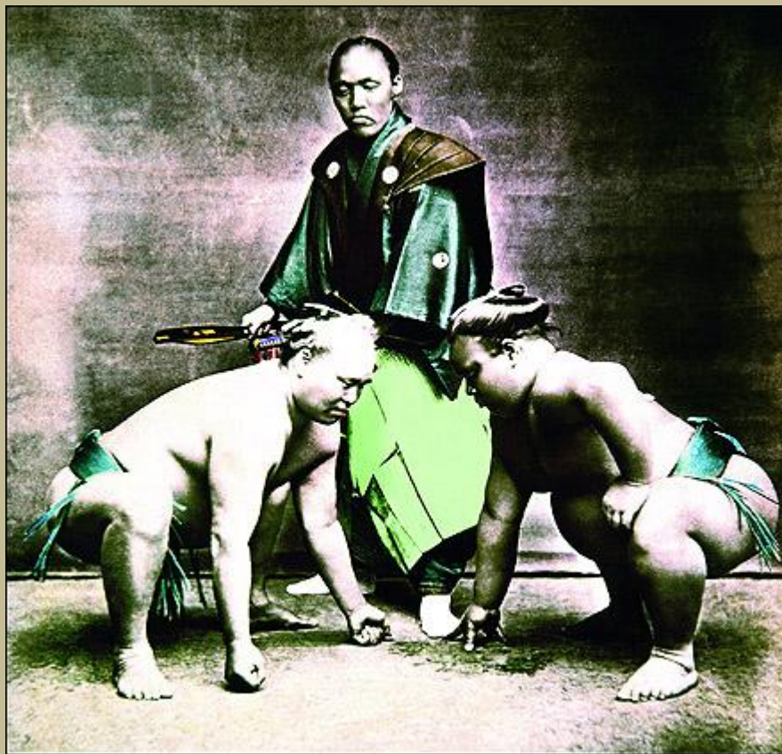
Combate de sumo. Fotografía a la albúmina coloreada a mano. Obra de Felice Beato, hacia 1868.