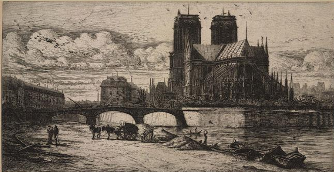
Charles Meryon (1821-1868), L'Abside de Notre Dame de Paris , 1854. Etching. Muy conocida por su arquitectura y gárgolas

sublimación, donde la hostilidad puede quedar despojada de su afán destructivo y descargarse sin perjuicio para el semejante o para los actores del ritual. Todas las técnicas japonesas en particular y orientales en general derivadas de las artes marciales y que hoy son deportes practicados y enseñados a utilizar pacíficamente son suficiente evidencia de esta evolución del arte de la guerra. La diferencia con otros deportes, como el fútbol, es que mediante sustituciones metafóricas las armas bélicas se disfrazaron de inocentes juegos, pero que movilizan pasiones y enfrentamientos que deben ser acotadas por los reglamentos.