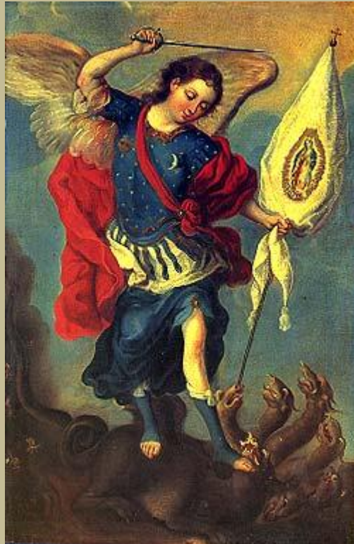
Anónimo. El Arcángel San Miguel derrotando al demonio con estandarte de Guadalupe. Siglo XVIII.

La nueva generación de psicólogos también necesitará dar un salto evolutivo, se deberán dejar de lado las falsas antinomias entre el conductismo y el psicoanálisis, concretamente creo que es posible desarrollar ejercicios de entrenamiento psicológico que no taponen ni escondan bajo la alfombra los conflictos psicológicos inconscientes. De esta forma las falencias anímicas pueden ser extirpadas de raíz y tenderían menos a la repetición. También los encuadres de las terapias deberán adaptarse a un mundo muy veloz, el deportista tiene muy pocos años para alcanzar su meta y, como en los F1, a mayor velocidad, menor tolerancia al error