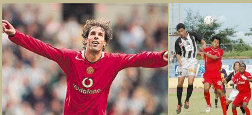
Diferentes clubes del Mundo reciben el nombre de Diablos Rojos En la foto: El Manchester de Inglaterra y el DR del América Nicaragua

El desarrollo de la valía no implica ser una mala persona o ver limitada la capacidad de amar, muy por el contrario, una adecuada sublimación no presenta riesgos en este sentido. Las deformaciones profesionales que se presentan muestran una exagerada agresividad en el sentido vulgar del término, y lo peor es que los restos o resabios de la tendencia destructiva no sublimada no solo disminuyen el rendimiento sino que operan en contra, tanto dentro de la cancha como fuera de la misma. Los verdaderos campeones tienen valores y códigos.