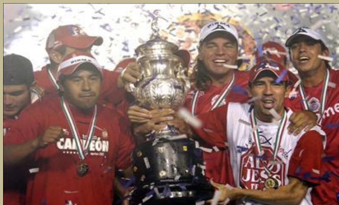
México: Diablos Rojos en Beisbol y Fútbol, Toluca

El desarrollo de la valía no implica ser una mala persona o ver limitada la capacidad de amar, muy por el contrario, una adecuada sublimación no presenta riesgos en este sentido. Las deformaciones profesionales que se presentan muestran una exagerada agresividad en el sentido vulgar del término, y lo peor es que los restos o resabios de la tendencia destructiva no sublimada no solo disminuyen el rendimiento sino que operan en contra, tanto dentro de la cancha como fuera de la misma. Los verdaderos campeones tienen valores y códigos.