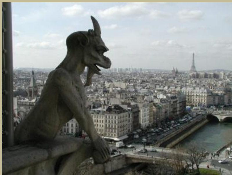
Gárgola ubicada en la catedral Notre Dame de Paris

El demonio en psicoanálisis es el ello, pero se trata del ello no pulido por el inconiente, es también la bestia en el sentido apocalíptico del término ( la bestia tiene número de hombre... es decir está en cada uno de nosotros). La eudemonía en sentido filosófico, significaría, dejarse poseer, dejarse llevar, por el buen Lucifer transformado en positivo. El problema ético que se nos presenta es poder discernir cual es un buen demonio .