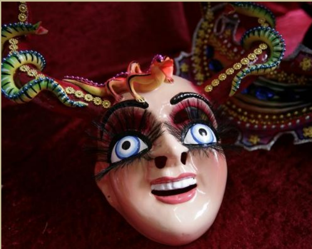
Bolivia - Máscara china supay

Es "mejor" persona, si se quiere, la que ha descargado sanamente su agresividad que aquella que la acumula por represión.