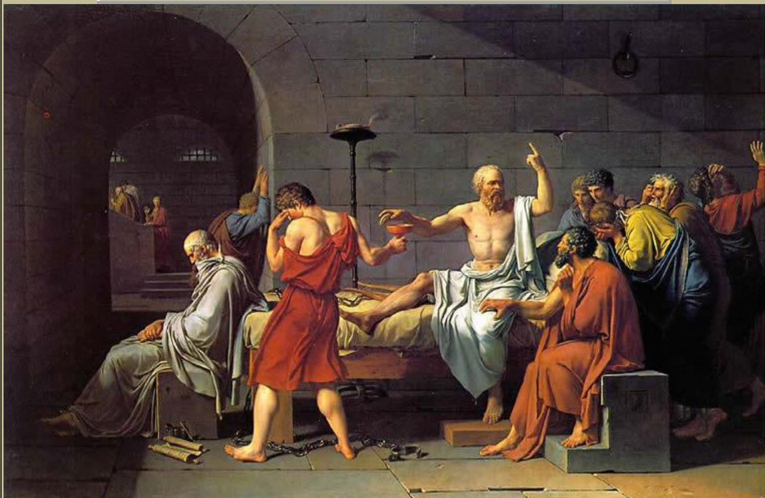
J-L DAVID: La muerte de Sócrates. 1787

Sócrates , (habiendo sido condenado a muerte, rehúsa pedir clemencia y se dispone a beber la cicuta)