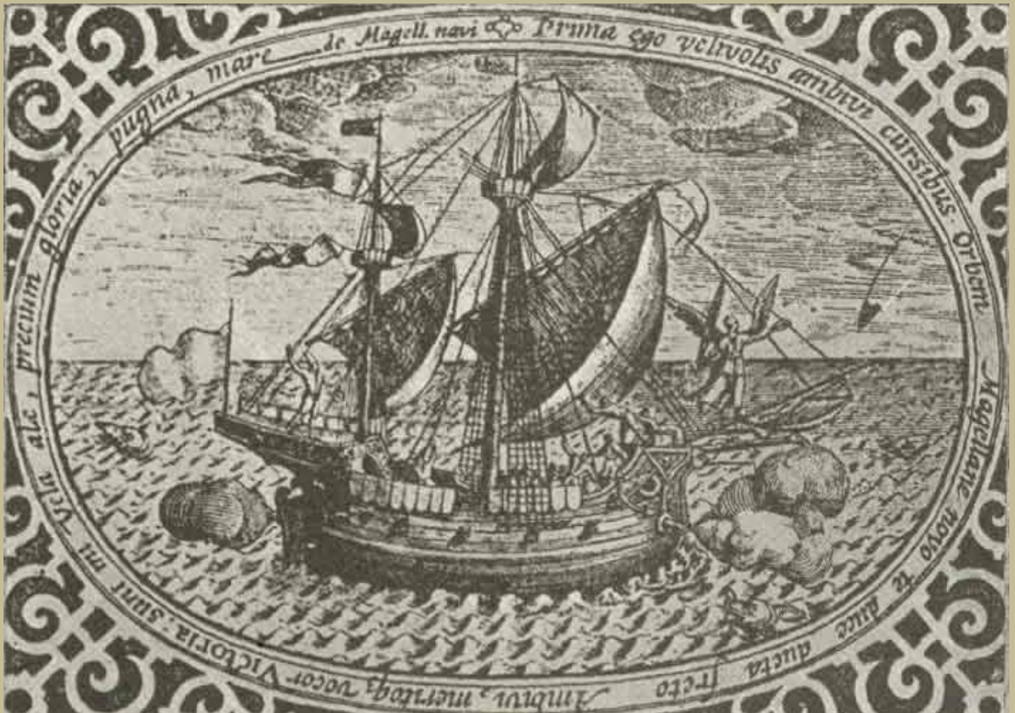
Un grabado del año 1603 muestra a la nave Victoria en la que Sebastián El Cano logró dar la primer vuelta al mundo

Este factor psicológico también lo encontramos en situaciones o expediciones extremas donde logran sobrevivir personas que a mi criterio tienen una cualidad especial, por ejemplo, durante los años 1519 a 1522, en el histórico viaje de Magallanes alrededor del mundo, partieron 237 hombres y regresaron solo 18, ¿fue solo fruto del azar? ¿o existía en ellos un savoir faire, un saber hacer, frente a la azarosa adversidad? De hecho, el mismo Magallanes perdió la vida en un enfrentamiento absurdo e innecesario con unos aborígenes donde sobrestimó el poder de sus armas de fuego.