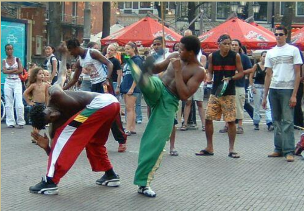
Capoeira en Amsterdam

La obra, en cuya realización participó también el festejado cineasta brasileño Fernando Meirelles, autor de "Ciudad de Dios" y "El Jardinero Fiel", relata la historia de ocho jóvenes de distintas ciudades y clases sociales que tienen algo en común: una extremada habilidad en el manejo del balón y el sueño de convertirse en astros del fútbol. Según Alves, todos los participantes comparten también la "ginga", el factor que hizo nacer el "jogo bonito".