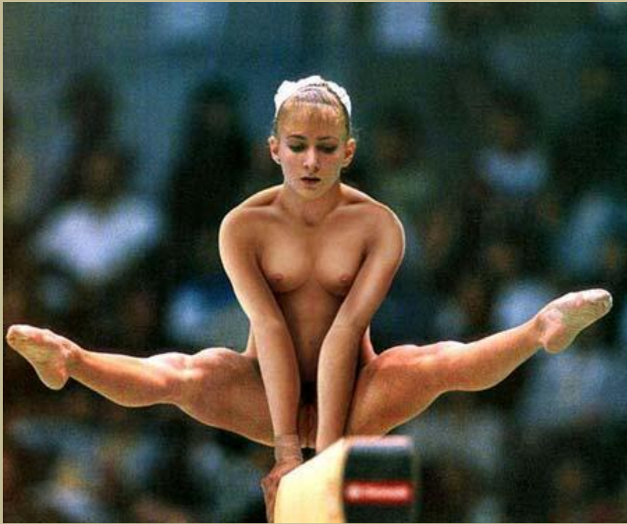
El arte y el erotismo congenian en diferentes eventos