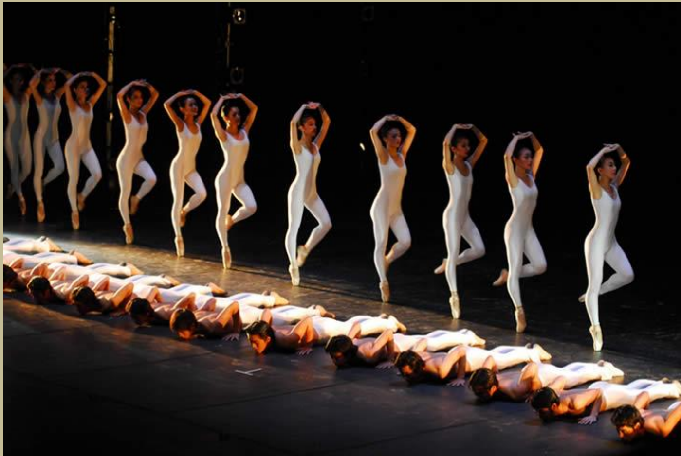
Danza en San Sebastián