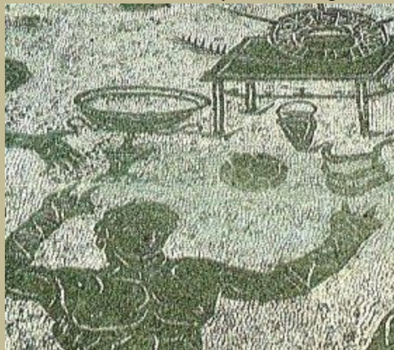
Una de las escasas evidencias del juego se encuentra en este mosaico descubierto en la ciudad de Ostia