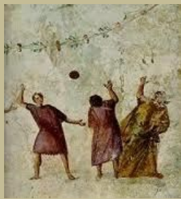
Izq. un dibujo recrea una escena del juego