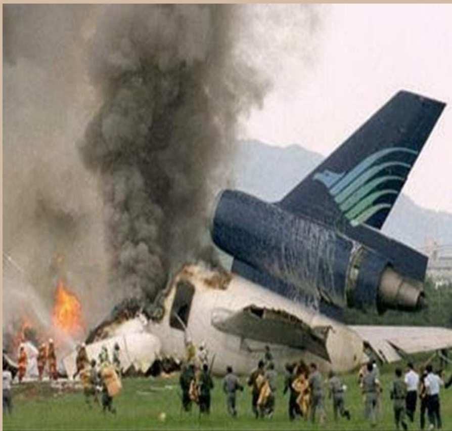
Foto de archivo sobre un accidente de avión