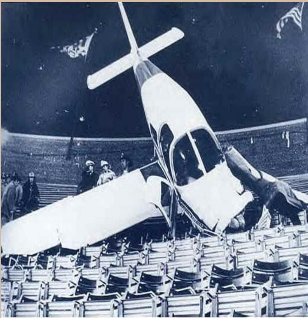
Una avioneta cae sobre un estadio afortunadamente vacío