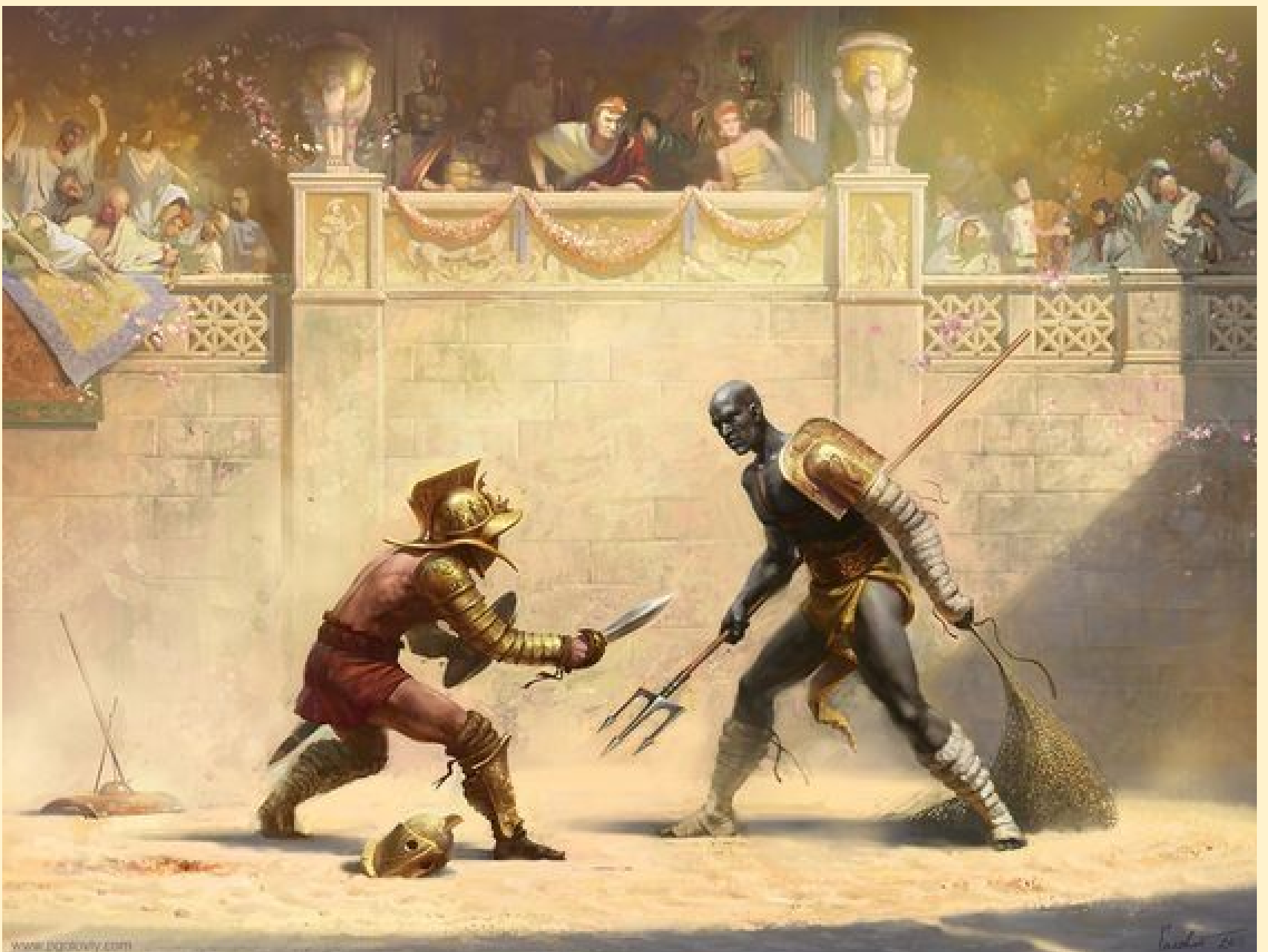
Imagen: Pollice Verso de Jean-Léon Gérôme

Sobre el discurso: El Hombre en la Arena es el fragmento más conocido del discurso La Ciudadanía en una República que Teddy Roosevelt pronunció en La Sorbona (Universidad de París, Francia) en 1910. Fuente: Wikipedia: Citizenship in a Republic.