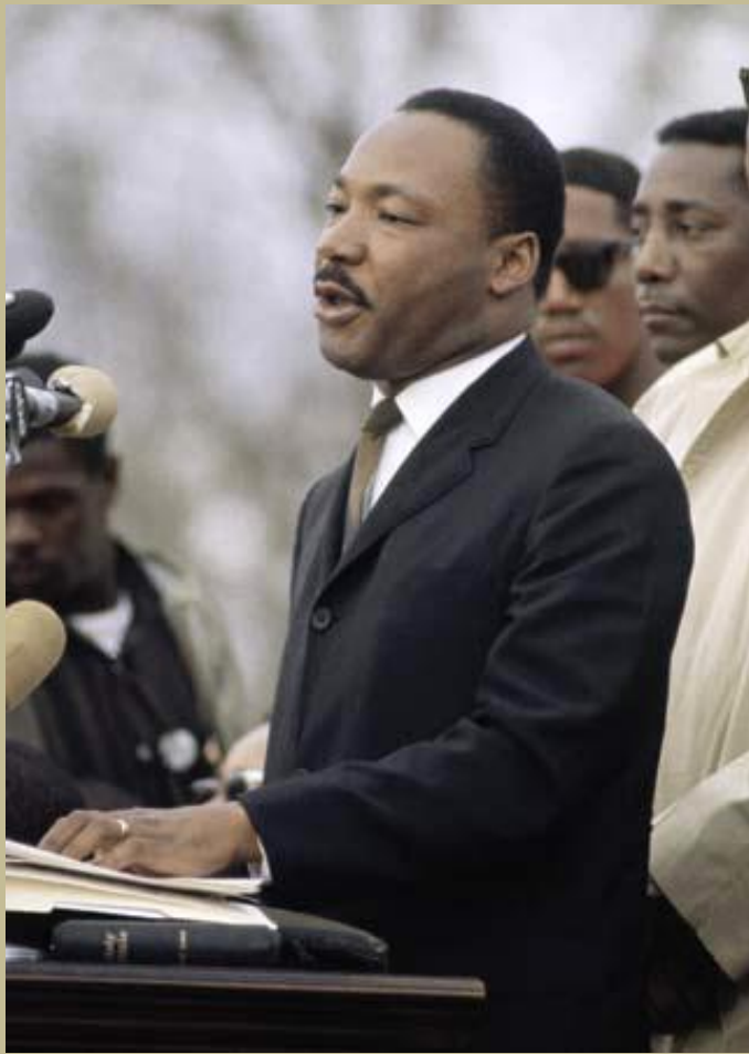
"Below is one of his last speeches, given 40 years ago and one year before his assassination, at Stanford University in April 1967 and titled the 'The Other America.'

La palabra negro está cargada de juicios de valor negativo por lo que generalmente se la evita con sinónimos como hombre de color o afroamericano . El término judío, que también sufre esta indeseable carga, suele ser reemplazado por sinónimos más amigables como paisano , ruso , o de la colectividad . La palabra palestino es sinónimo de desprecio para muchos. El término raza ha tenido que ir dejándose de lado por las consecuencias de de discriminación o racismo que ha ido tiñendo y contaminando su significado, haciendo de la diferencia entre