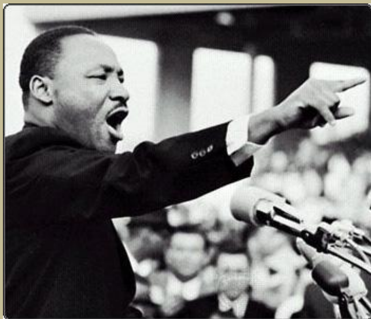
Martin Luther King en una concentración por la libertad en 1962

Hoy soy yo. Mañana podría ser otro dirigente o no importa quién, hombre, mujer o niño, quien sea víctima de la anarquía y la brutalidad. Espero que esta experiencia termine por ser socialmente constructiva demostrando la necesidad urgente de la no violencia para gobernar los asuntos de los hombres.