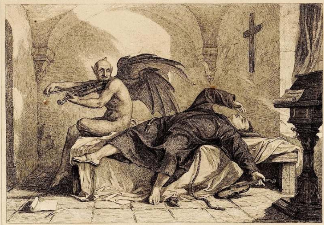
Futlin's Traum -hells Knabe.