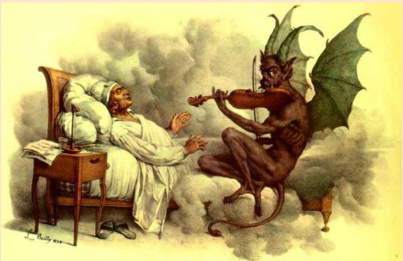
El sueño de Tartini de Louis-Léopold Boilly (1824)

Giuseppe Tartini conoce al diablo y compone una de las mejores canciones al violín de la historia