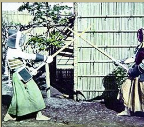
Luchadores de "kendo". Fotografía a la albúmina coloreada a mano. Realizada hacia 1890