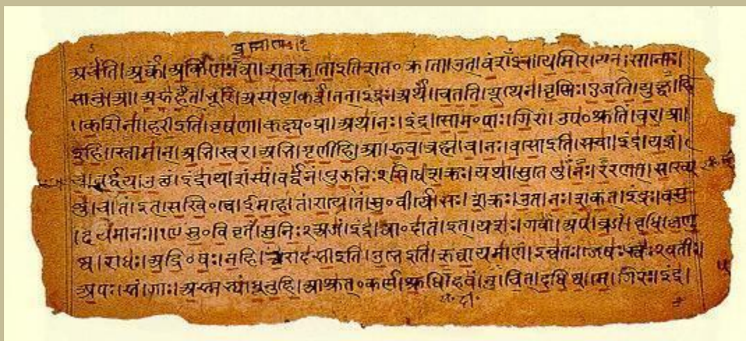
Antiguo manuscrito Védico