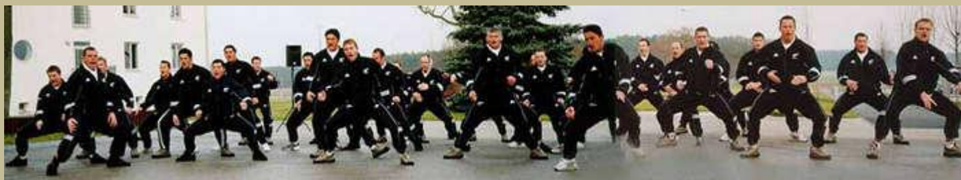
Al modo de un entrenamiento guerrero militar los All Blacks practican el canto del Haka

Otra traducción: Está muerto Está muerto, Está vivo Está vivo, Este es el hombre peludo, quien ha hecho que el sol brille de nuevo por mí. Subir escalas Subir escalas, Subir hasta el máximo, El sol brilla!