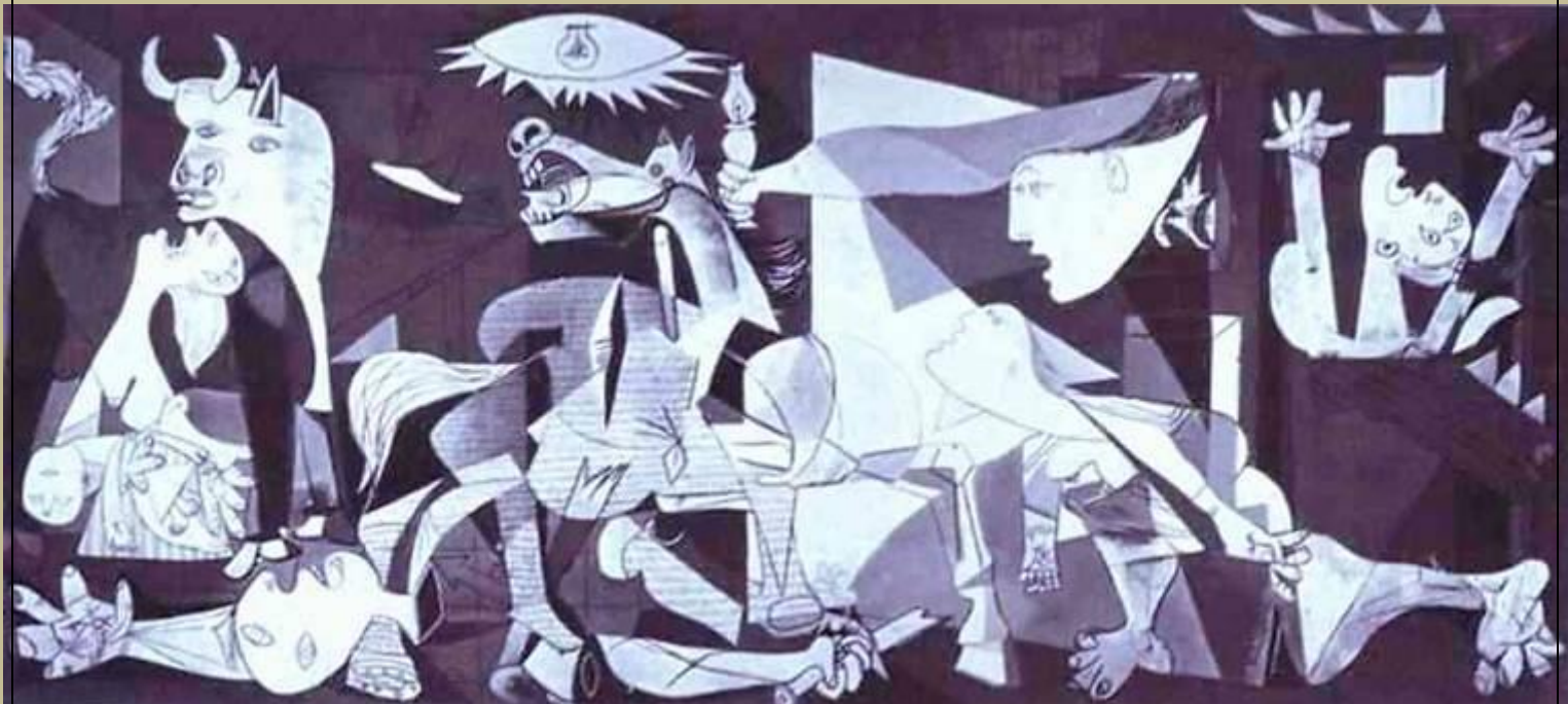
Guernica por Pablo Picasso 1937

El 26 de Abril de 1937 aviones nazis bombardearon Guernica, una pacífica localidad de España, que estaba en plena guerra civil. La misión no tenía objetivos militares y solo era un entrenamiento para la legión Cóndor que tendría un importante papel militar en los planes bélicos de Alemania en la conflagración mundial que se iniciaría en 1939. Eligieron un día donde todos iban al mercado, fue un experimento de aviones, pilotos y bombas. Picasso inmortalizó la masacre.