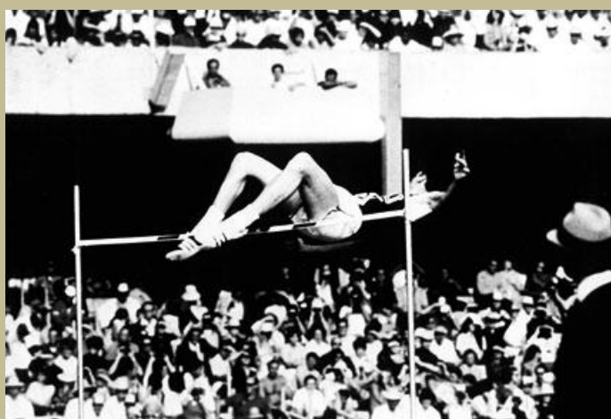
Dick Fosbury, creador del estilo Flop ganador de la medalla de oro en los Juegos Olímpicos de México 1968 (2.24 m)