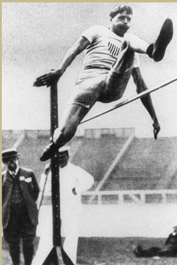
Ray Ewry, campeón de salto en alto en Los Juegos Olímpicos de 1904 ( St. Louis) y LONDRES (1908) saltando con TÉCNICA tijeras

considerándome un chiflado y algunos como un snob por salirme de las normas conocidas. Hasta que gané en México 1968 pasando a la categoría de héroe". 1