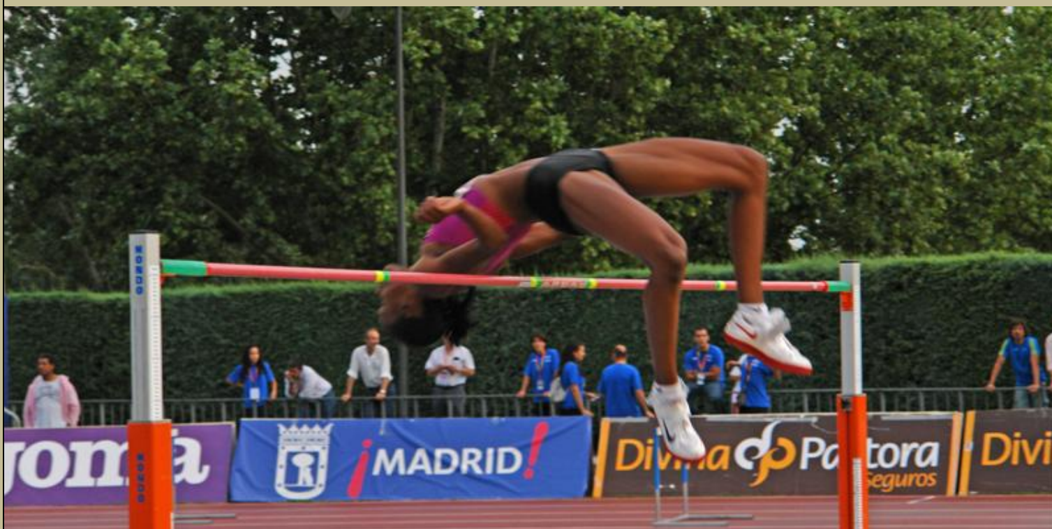
En la actualidad esta técnica ha sido adoptada casi universalmente ya que tiene importantes beneficios biomecánicos