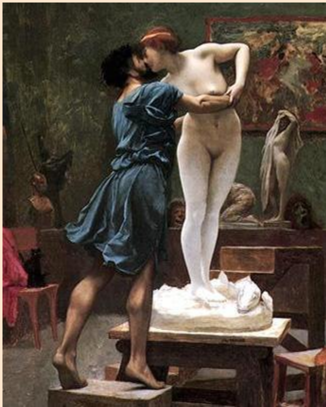
Jean-Léon Gérôme - Pigmalión y Galatea