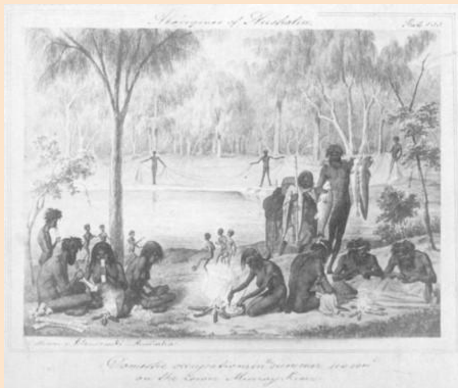
Antiguo dibujo: Algunos niños parecen practicar una especie de juego con pelota en una tribu australiana demostrando la universalidad del deporte